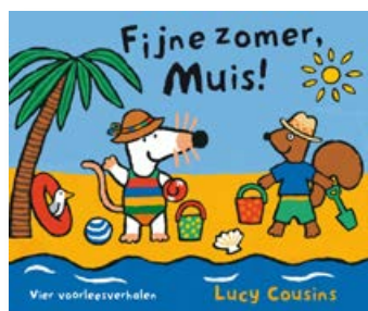
Fijne zomer, muis! Lucy Cousins Leopold ISBN: 978 90 258 6061 5