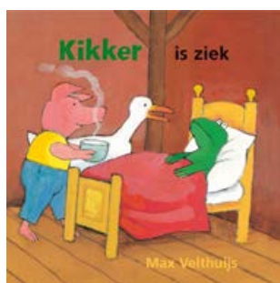
Kikker is ziek Max Velthuis Leopold 978 90 258 7149 9

Op den duur zult u zien dat uw kind zelf herkenbare klanken bij de plaatjes verwoordt. Neem dagelijks de tijd om samen met uw kind een boekje te lezen.